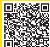
Agenda ronde-tafelgesprekken dinsdag 2 juni

Alle gesprekken kunt u live volgen (beeld + geluid) via de website van de gemeenteraad: voorst.raadsinformatie.nl. Scan de QR-codes met u smartphone of tablet-computer om de agenda en de vergaderstukken online te bekijken