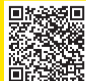
Agenda ronde-tafelgesprekken woensdag 3 juni

De volgende onderwerpen staan op de agenda: Dinsdag 2 juni vanaf 19.30 uur