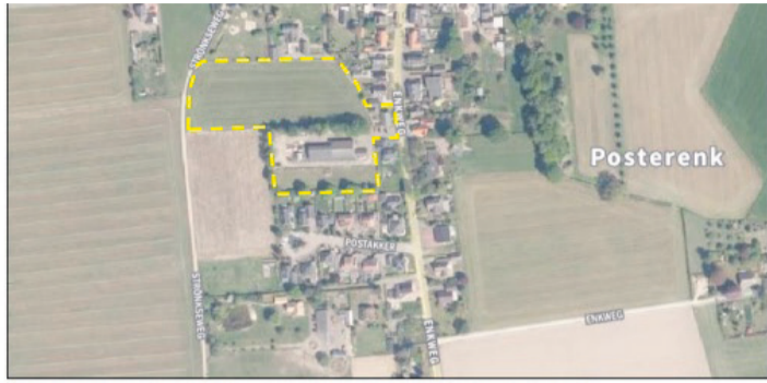
Globale ligging en begrenzing plangebied (geel omlind).